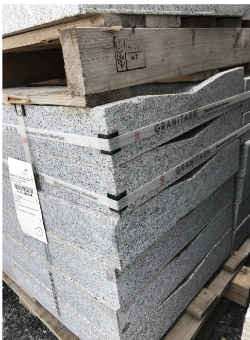
Dalles granit de caniveau